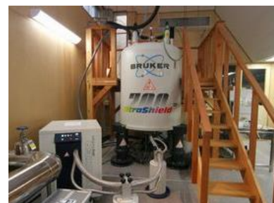
フロー型クライオプローブ付 700MHzNMR

これらの設備は、教育機関としては国内随一で、世界的にも比肩できる場所はそれほど多くはありません。また、700MHz LC-NMR 装置に装着されている「フロー型クライオプローブ」は、本学が開発し、標的タンパク質に結合する薬物をスクリーニングすることができるだけでなく、特に標的タンパク質が NMR 用に高価な安定同位体（例えば SAIL アミノ酸など）でラベルされているときには、化合物に結合しなかったタンパク質を回収、再利用することができるといった非常にユニークな特徴があるほか、LC 装置により未精製の化合物を同定することも可能です。950 LC-NMR 装置も同様な機